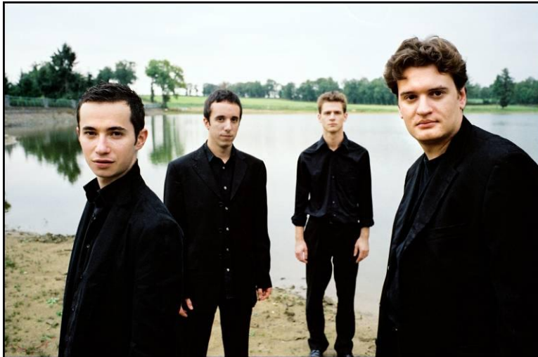
▲ Quatuor Ebène

Les concerts ayant lieu au Grand-Théâtre sont dorés et déjà réservables au Grand-Théâtre.