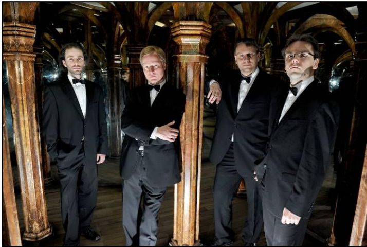
▲ Quatuor Zemlinsky